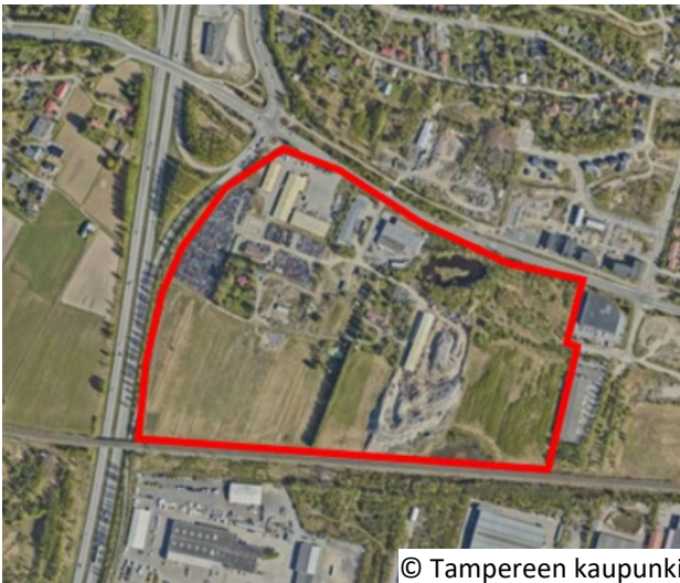
Kaava-alueen rajausta ilmakuvassa